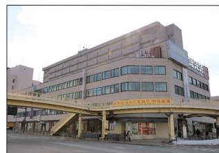
小樽駅前第一ビル外観

弊社は、昭和 44 年から小樽市が全国に先がけて施行した小樽駅前再開発事業に伴って建築された施設建築物並びに附帯施設を管理運営するため、小樽市が主体となり設立されました。設立当初は、小樽市から開発部長が専務取締役として出向するなど、社員のほとんどが市職員でしたが、現在は小樽市からの出向者はなく、専従職員のみで事業を展開しています。